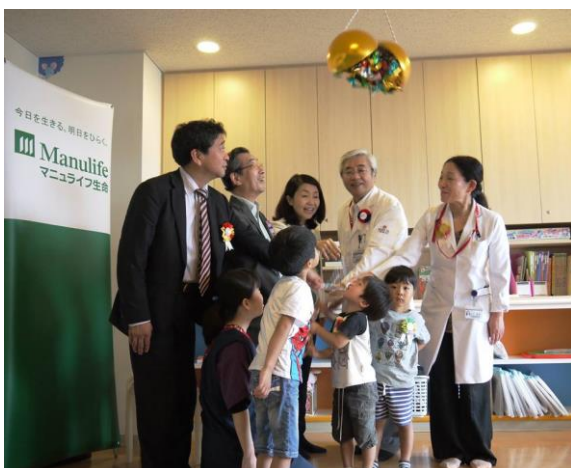
「わくわくる一む」の開設を祝うくす玉を割る子どもたち