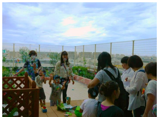
「わくわくがーでん」のウッドデッキでシャボン玉を楽しむ子どもたち